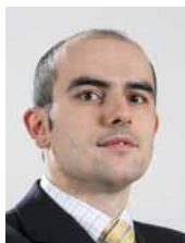
Michal Kaplan ředitel České rozvojové agentury (ČRA)