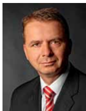
Jan Michal vedoucí Zastoupení Evropské komise v České republice